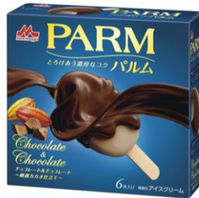
PARM(パルム) チョコレート&チョコレート ~厳選カカオ仕立て~(6本入り)