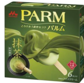
PARM(パルム) 抹茶 (6本入り)