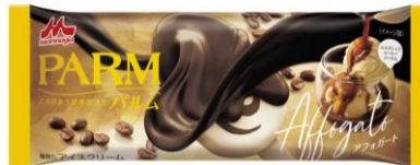
PARM(パルム) アフォガート(1本入り)