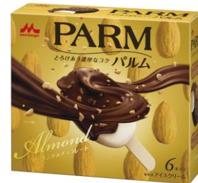
PARM(パルム) アーモンド&チョコレート (6本入り)